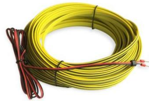
图 3 固定式感应线（出厂前已连接）